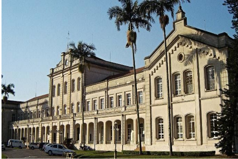
Figura 4 - Escola Superior de Agricultura Luiz de Queiroz da USP