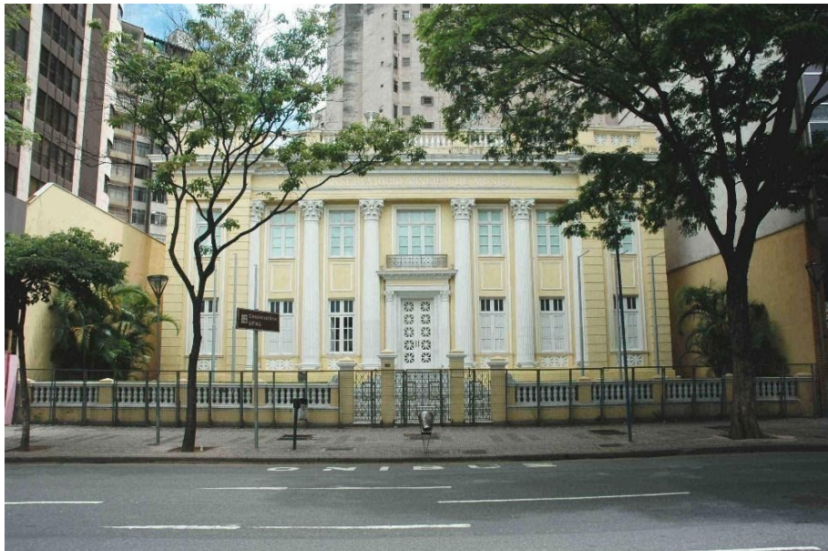
Figura 1 - Conservatório Mineiro de Música

Histórico e Artístico de Minas Gerais – IEPHA-MG), pertence à Universidade Federal de Minas Gerais – UFMG e está localizado no grande centro de Belo Horizonte. Com isso, ele precisa atender aos interesses da União através da UFMG, os próprios interesses universitários da UFMG, as regras de proteção estaduais e municipais, além da legislação arquitetônica e urbanística da cidade. A sobreposição destes interesses pode ser observada através da Figura 2.