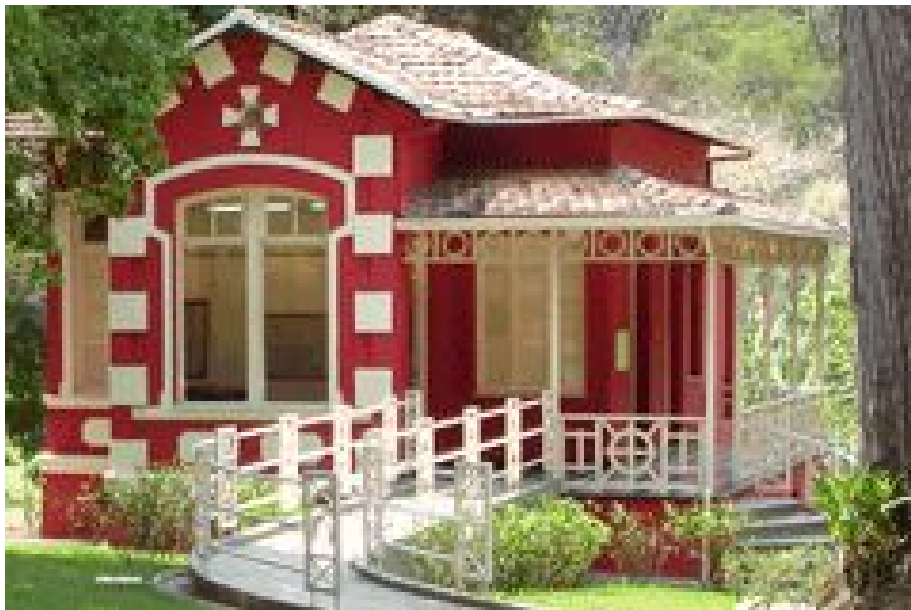
Figura 7 - “Palacinho” - Museu de História Natural e Jardim Botânico da UFMG

Mesmo sendo responsável por um conjunto tão significativo, não existe uma base de informações unificada. É possível identificar em uma revisão bibliográfica que existem estudos sobre algumas edificações de maneira isolada, como a Casa Padre Toledo (DANGELO et al., 2012) e (CRUZ, 2015) e a Escola de Arquitetura (LE MOS; DANGELO; CAR SALADE, 2011), porém existem edificações com pouco ou nenhum material disponível, como o Palacinho - Figura 7.