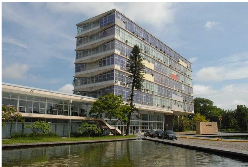
Figura 3 - Prédio da Reitoria da UFMG

As universidades públicas brasileiras são responsáveis pela guarda de um conjunto de imóveis tombados heterogêneo que pode, em alguns casos, ter toda sua história ligada à universidade da qual fazem parte como o prédio da Reitoria da UFMG 3 - Figura 3; em outros casos, podem ser oriundos de escolas mais antigas que a universidade da qual fazem parte e foram incorporados a partir da expansão das mesmas, como a Escola Superior de Agricultura Luiz de Queiroz da Universidade de São Paulo da USP 4 - Figura 4; e em outros cenários, são parte de tecidos urbanos mais antigos do que a própria universidade e não tinham como intuito inicial fazer parte de uma instituição de ensino, mas por circunstâncias diversas acabaram sendo incorporados, como a Casa de Dona Yayá da USP 5 - Figura 5.