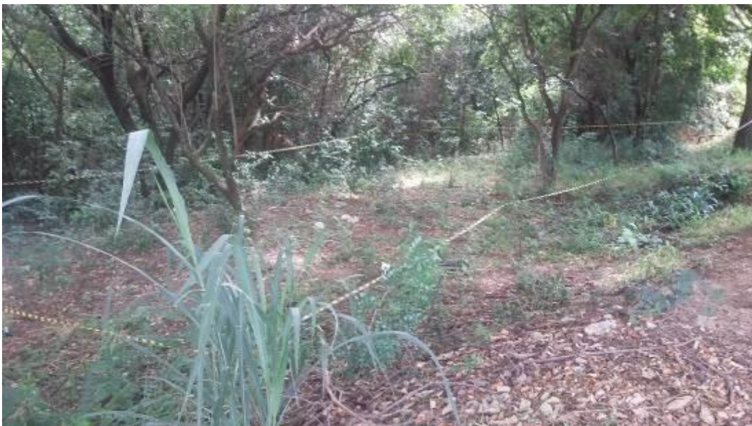
FIGURA 1 – Área escolhida para o transplante de plântulas.

A Figura 1 a seguir apresenta uma imagem da área escolhida para o transplante.